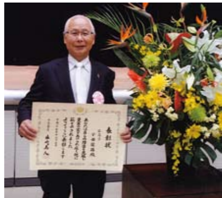
平成27年度 障害者自立更生表彰（厚生労働大臣表彰） 平成27年12月3日